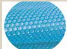
1x Thermo Unterlage