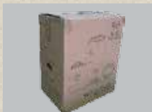
1x Spa Steuereinheitsbox