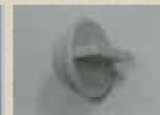
1x Schraubbarer Stopfen