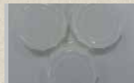
3x Schraubbare Verschlusskappen