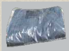
1x Spa plus Abdeckung

Bitte stellen Sie sicher, dass alle hier abgebildeten Teile in der Lieferung enthalten sind. Inhalt: