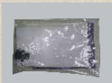
1x Reparatur Set